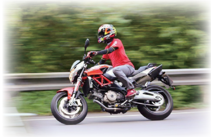
機器腳踏車使用牌照稅稅額表

重型機車自 92 年 1 月起開放進口後，國內喜歡把玩機車者，有機會一試身手。購買新機車時，不要忘了辦理請領牌照及繳納使用牌照稅。原則上買機車、賣機車申領牌照及過戶、報廢、註銷等手續跟汽車相同。唯一不同的是 150CC 以下機車牌照稅稅額為零，也就是說 151CC 以上的機車才要繳牌照稅，機車族不能不知道，其稅額表列示如下：